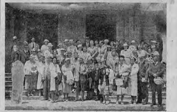
Recoge la foto el grupo de turistas norteamericanos que llegó ayer a esta capital, y saldrá hoy de regreso a Limón para continuar la gira que realiza por estos países.

Un dolor de cabeza? Una Pastilla Oriental!