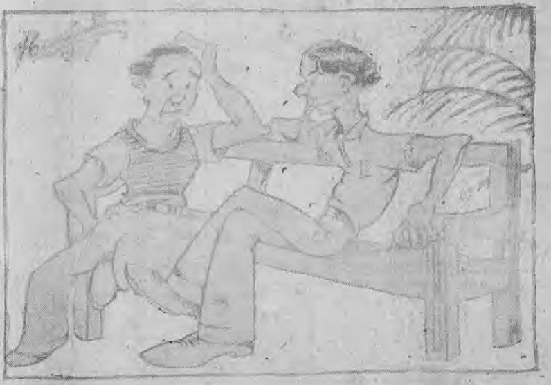
—¡Este don León Cortés ya me está resultando un gran cucharilla, ahorita se le antoja levantar también el censo de los que vivimos a costillas de ellas!